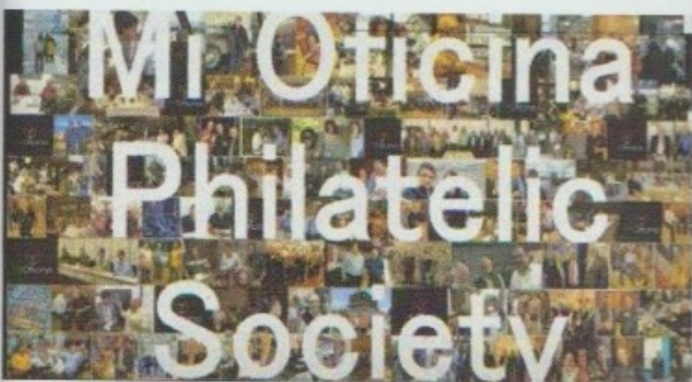
Carátula de Mi Oficina Philatelic Society con la que se abren las charlas

Simon Sinek, renombrado autor y líder inspiracional británico, tiene una conferencia vista por más de 57 millones de personas en Ted Talks llamada 'Como los grandes líderes inspiran acción' ( https://tinyurl.com/MO-Simon-Sinek ) con ella se puede